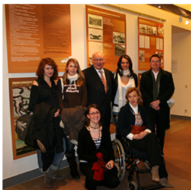
Brandenburger Vertreter mit Walter Momper...