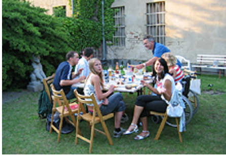
Feiern nach getaner Arbeit Jahresabschlussfeier 2005 im Garten des Museums im Frey-Haus - auch in dieser Projektphase waren alle gut in Form.