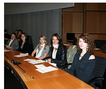
... und auf den Plätzen der Abgeordneten